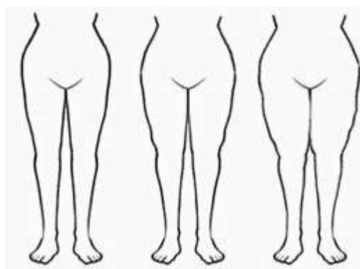
Hier sind die Stadien 1-3 beim Lipödem zu sehen.