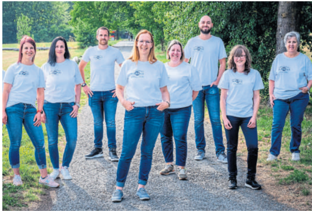
Das engagierte Team von Sanitätshaus Schäfer berät kompetent und individuell.

Parkplätze vor Ort – Hausbesuche möglich